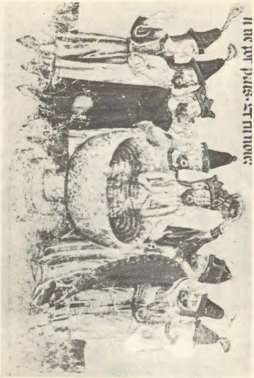
شکل تمسید منگورخان نسخه خطی های تون