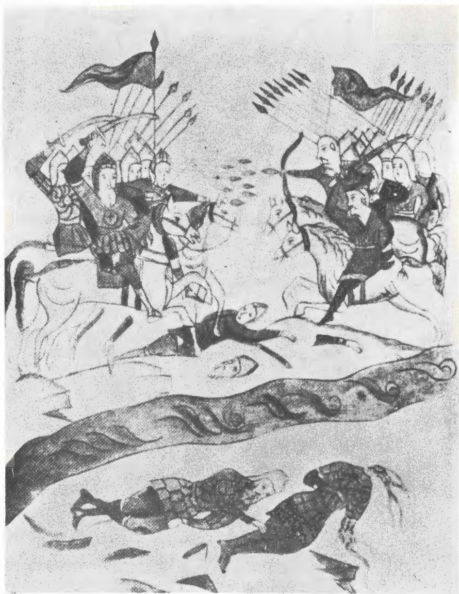
نبرد درکنار رود سیت در ۴ مارس ۱۳۳۸