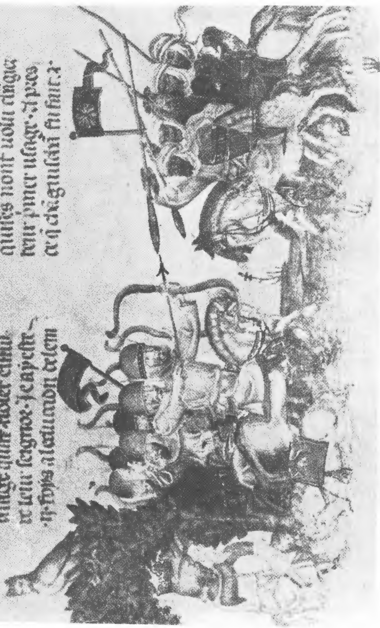
نبرد اسواران مغول با خاوریان نسخه خطی های تون

ce ne po: raignone ne po: rdece qu'alent con quies mont uolt d'ingie leur pmer usage. Apres ce q' d'ingulain fist fait.