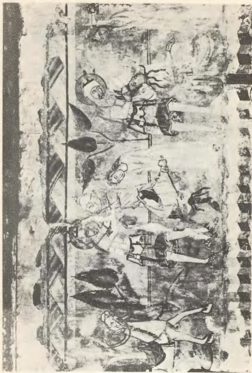
شاهزاده لادیسلاو، پانوی را از دست کومانها نجات میدهد. تقاشی دیواری کلیسیا زلنس در رومانی (سده ۱۴م.)